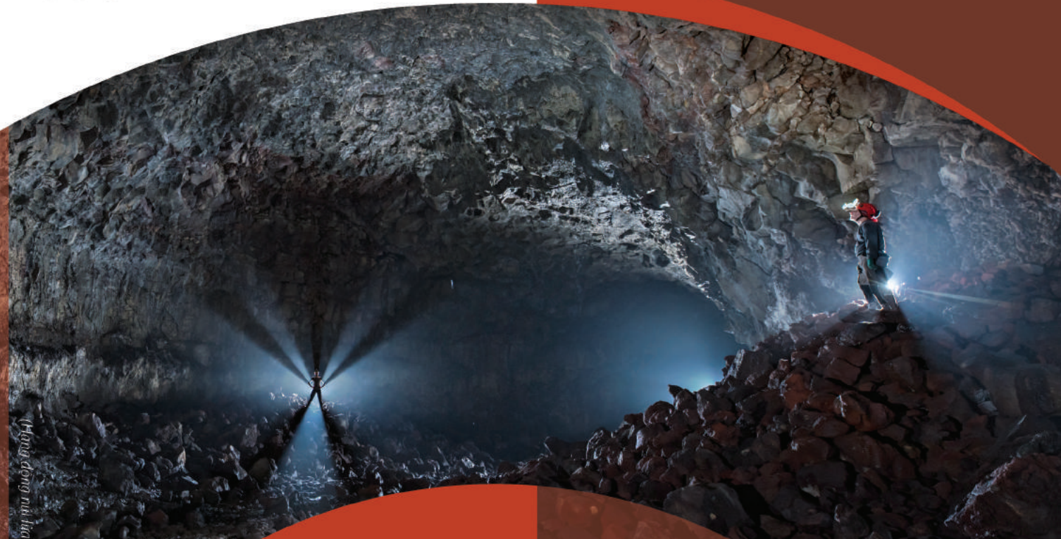
(Hình động núi lửa)